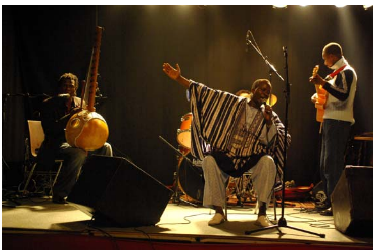
Hoordol Feestival 6 oktober 2007

vzw KetaKeti zelf heeft GEEN werkingskosten; elke euro die we hier in België verzamelen gaat integraal naar Nepal. In naam van de le- raars, de leerlingen en hun ouders: onze hartelijke dank!